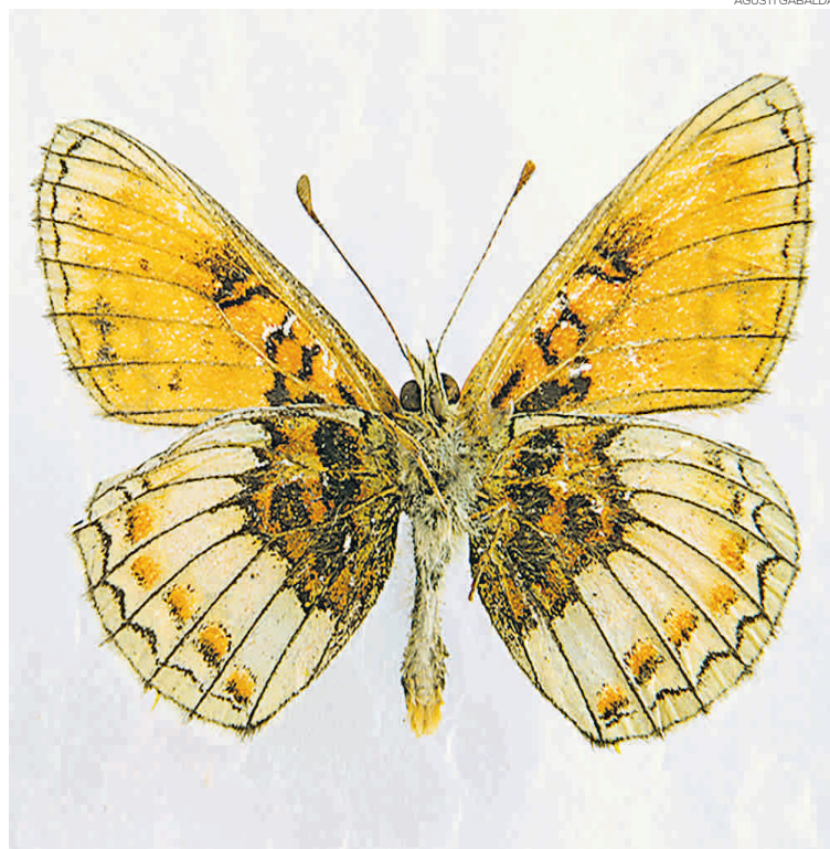
Melitaea parthenoides, nou exemplar a la Casa de les Papallones

Segons el responsable del museu, des fa anys van deixar de capturar papallones, però arran de la singularitat d'aquest nou exemplar van fer una ex-